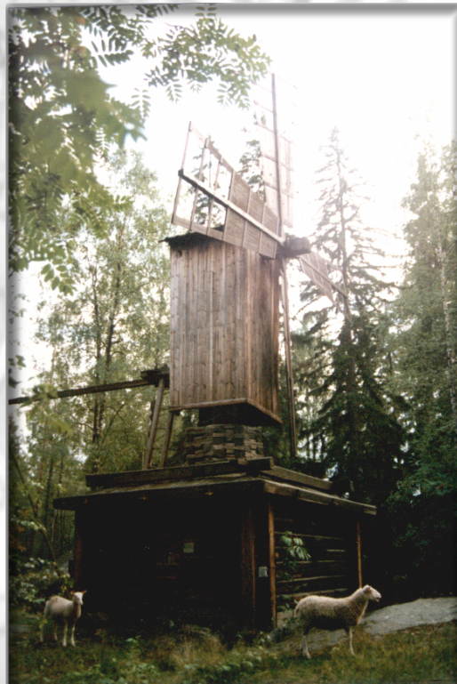
MOLINO DE VIENTO EN HELSINKI (FINLANDIA).