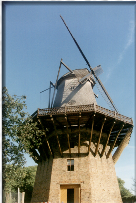
MOLINO DE VIENTO EN SANSSOUCI, POSTDAM, ALEMANIA.

III J o r n a d a s d e M o l i n o l o g i a