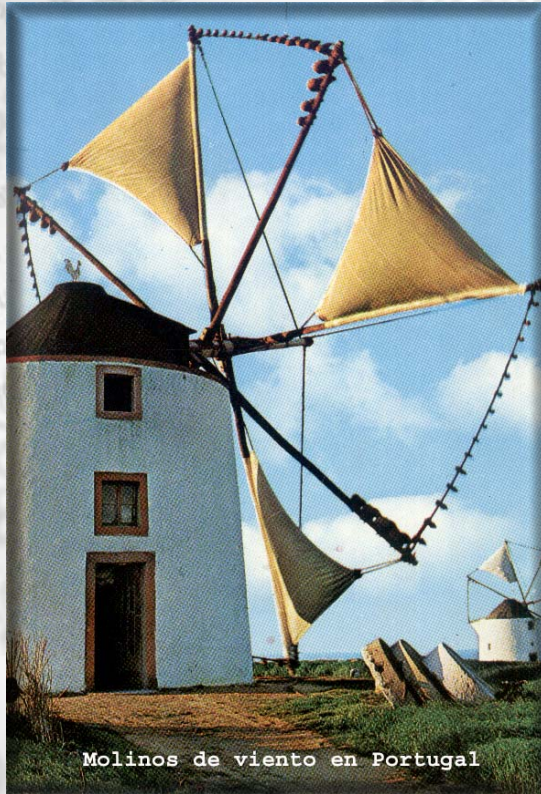
Molinos de viento en Portugal