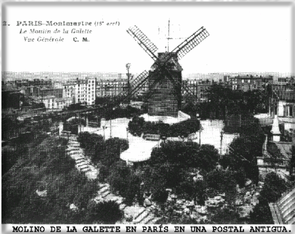
MOLINO DE LA GALETTE EN PARÍS EN UNA POSTAL ANTIGUA.

III J o r n a d a s de M o l i n o l o g i a