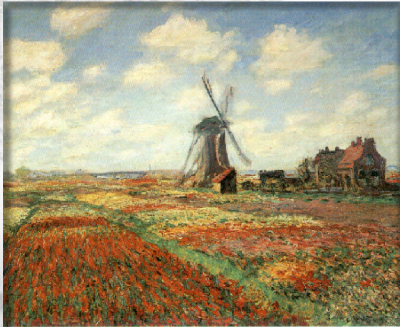
CAMPOS DE TULIPANES EN HOLANDA (1886) ÓLEO DE CLAUDE MONET. (París, Museo de Orsay).