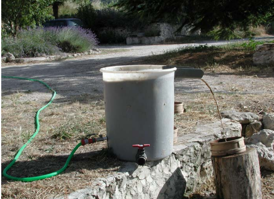
(FIG. 3). MÁQUINA DE FLOTACIÓN (UNIVERSIDAD DE VALENCIA)

en algunos casos puede utilizarse una malla de 0,25 mm. para los restos más pequeños, como algunas semillas de plantas silvestres (Alonso et al. 2003).