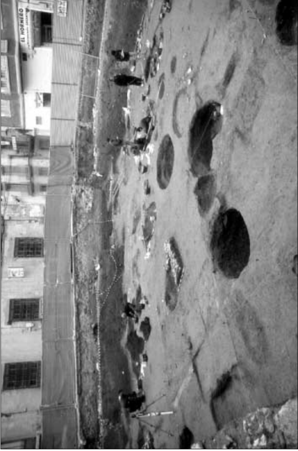
Glorieta de San Vicente: vista general del solar durante su excavación