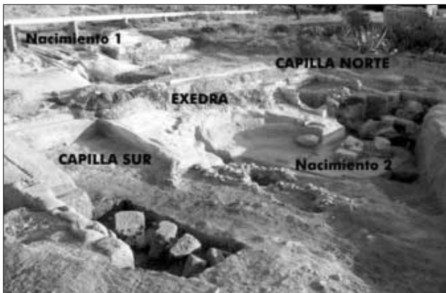
Baños de Fortuna: vista general del conjunto balnear edificad en torno al nacimiento

Las coincidencias de peso con los ejemplos tunecinos, con el caso de Locri, Magna Grecia, con los griegos e incluso con los orientales, insinúan cierto aire extranjero, quizás oriental, filtrado por lo helenístico, que no debería ser común en una población rural típica de época augustea. ¿Quién construye realmente ese graderío en torno al «nacimiento» de los baños romanos de Fortuna?, ¿hasta qué punto desaparece el sustrato semita de los territorios hispanos?, o en su defecto ¿qué grado de romanización puede alcanzar un punto alejado de la costa como éste?