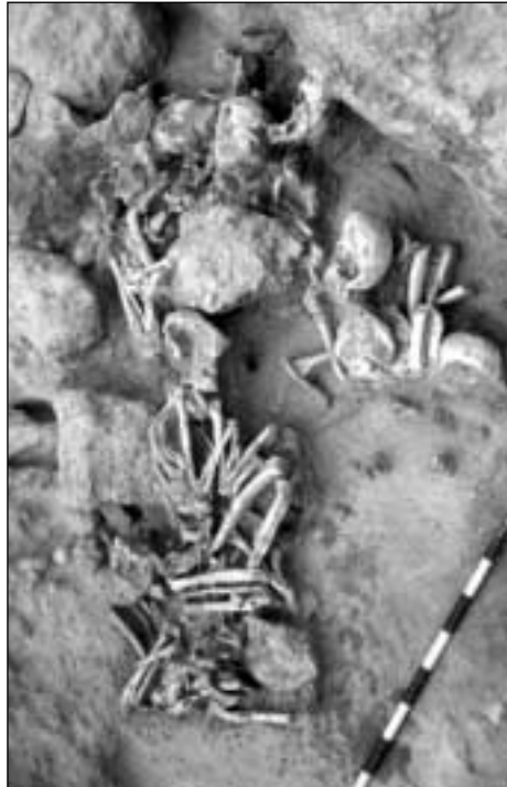
Cabezos Viejos. Vista del enterramiento colectivo durante su excavación

El rico y variado ajuar indica un lapso corto de tiempo para el conjunto del enterramiento. La tipología lítica, concretamente algunas puntas de flecha o algunas formas que imitan tipos metálicos, así como la presencia de un puñal de sílex pulimentado y con retoque en peladura, indican una cronología avanzada, probablemente del Calcolítico Final, aunque no se haya documentado ni campaniforme ni elementos metálicos.