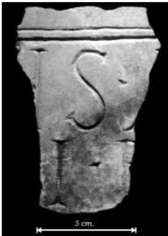
Los Villaricos: fragmento de inscripción recuperado en la campaña de 2001