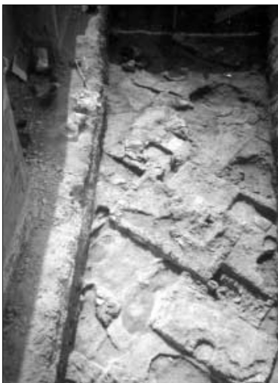
Solar de c/ Gloria, 19: vista del conjunto de sepulturas con estructuras tumulares excavado en el año 2001

Un pasillo interior con dirección suroeste-noreste y un espacio libre con un posible ara central, relacionado con la tumba 16, organizan y planifican todos los enterramientos conservados.