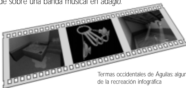
Termas occidentales de Águilas: algunos detalles de la recreación infográfica

Cuenta con una introducción al mundo romano y sus principales complejos termales a través de fotografías y mapas explicativos. A ésta le sigue la reconstrucción elaborada por ordenador del edificio, que mediante un paseo virtual lleva al espectador a visitar todos los espacios del mismo diseñados con todo realismo y detalle ( apodyterium, caldaria, praefurnia, palestra, etc... ), así como algunos objetos utilizados en la época. La reconstrucción se inspira en un modelo hipotético discutido por especialistas sobre la base documental de las dos excavaciones realizadas en la historia reciente. Para terminar se presenta un recorrido por los principales yacimientos arqueológicos de la ciudad de Águilas y se reflexiona sobre su función social. A toda la obra acompaña una narración explicativa que se funde sobre una banda musical en adagio .