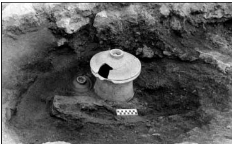
Coimbra del Barranco Ancho: tumba nº 145 en curso de excavación

La conclusión de este proyecto de investigación a lo largo del periodo 2002-2004, si fueran necesarias prórrogas, puede terminar de convertir a Coimbra del Barranco Ancho en un yacimiento paradigmático para el saber de la arqueología ibérica de la muerte. A la que habrá que sumar nuevas excavaciones en el Poblado en años venideros de manera que el conocimiento y la información histórico-arqueológica que proporcione Coimbra sea completa.