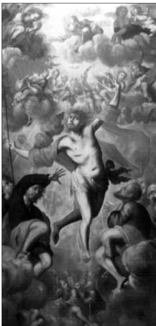
Lienzo «Descenso de Cristo a los Infiernos». Aspecto general tras su restauración

Debido al buen estado de la tela original, se intenta salvaguardar ésta, evitando en lo posible un nuevo reentelado, que aparte de cubrir el tejido original, conlleva un proceso traumático para la obra de arte. Se protege la cara anterior de la obra para realizar una limpieza mecánica del reverso y se colocan unas bandas de tensión en el perímetro de la tela original para llevarlo a un nuevo bastidor y proceder a su tensado. Pero no se obtiene el éxito deseado, pues el tensado no es del todo correcto, quedando unas pequeñas deformaciones imposibles de eliminar. No quedando más solución que un nuevo reentelado, éste se realiza con un adhesivo sintético termoplástico. Se realiza una limpieza mecánico-química de la pintura, eliminando suciedad, barnices oxidados y reintegraciones desafortunadas. Los estucos realizados con cera, no originales, son sustituidos por estucos realizados con sulfato aglutinado en cola orgánica, técnica similar a la que realizó el autor en la capa de preparación de la obra. La reintegración se limita sólo a las lagunas existentes, realizándose ésta con pigmentos aglutinados en resina acrílico cetónica. Para finalizar, la obra es protegida por diversas capas de barniz aplicadas a pistola.