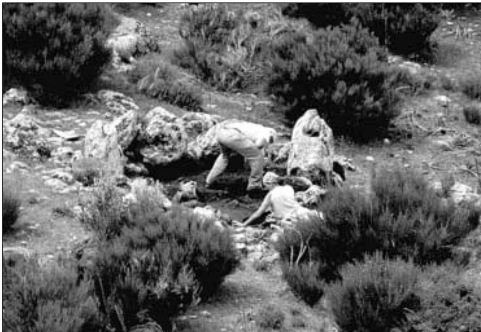
Cerro de las Víboras de Bajil: trabajos de excavación en el sepulcro megalítico número 6