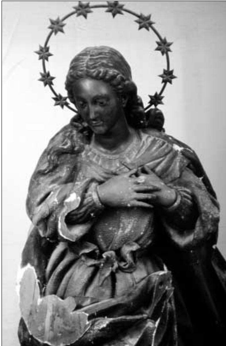
Virgen de Singla: anterior a su restauración

El barnizado final protege la obra obteniendo un resultado equilibrado de brillo. La duración de los trabajos se prolongó durante seis meses.