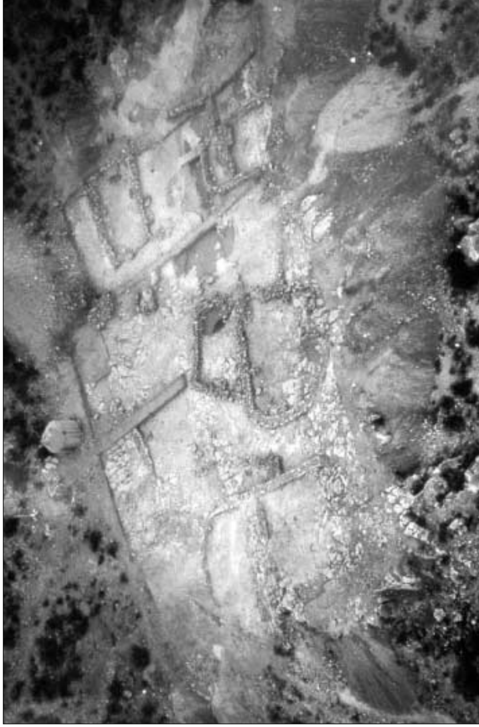
Cerro de Murviedro: vista aérea de la zona excavada en la campaña de 2001