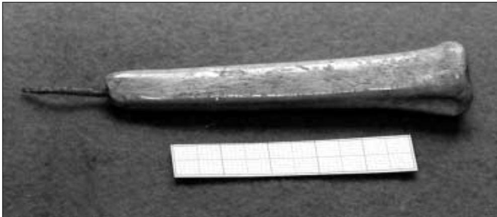
Cerro de las Víboras de Bajil. Punzón-lezna de cobre/bronce con su emangue original, hallado en el cuadro 34

Al finalizar la campaña se volvieron a adoptar varias medidas de protección de las zonas excavadas y se cubrió con tierra el cuadro guía, que presentaba alteraciones que podían suponer cierta peligrosidad para los visitantes ocasionales. De esa forma, se preservan también las estructuras del cuadro.