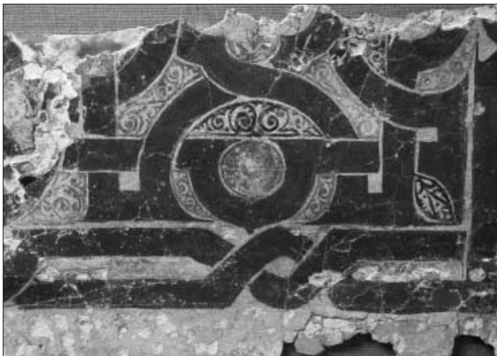
Santa Clara la Real: detalle de uno de los zócalos pintados pertenecientes al antiguo Alcazar Ceguir

La pintura mural ornamentaba un largo salón de más de 10 m provisto de una alcoba sobreelevada en el costado occidental. Aunque incompleta, la decoración responde a los característicos entrelazados que generan motivos geométricos divididos en cartelas o paneles cuadrangulares conocidos desde el siglo XI. La peculiaridad y espectacularidad de los hallados en Santa Clara estriba en que los espacios residuales que dejan los trazados geométricos, habitualmente vacíos, también se encuentran profusamente decorados con motivos vegetales, especialmente piñas y palmas, en negro, azul y naranja o rojo degradado. Las reservas entre cartelas presentan una decoración vegetal compuesta de un eje central del que surgen tallos secundarios de estructura circular con palmas digitadas y piñas. De gran importancia ha sido la verificación de que el paño pintado en cuestión trasdosaba a otros zócalos pintados de similar ornamentación geométrica, pero carentes de estructura vegetal. Como también la constatación material de que todos los zócalos pintados fueron destruidos al recrecer el nivel de circulación del salón en más de 30 centímetros. Todo ello viene a demostrar la ocupación continuada de las estructuras arquitectónicas durante largo tiempo y plantea la hipótesis de que el actual emplazamiento de Santa Clara fuera un mustajlas o dominio particular de los emires o del Estado islámico desde antiguo.