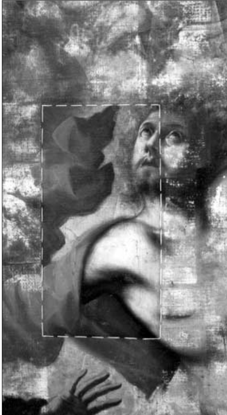
Lienzo «Descenso de Cristo a los Infiernos». Detalle del testigo durante el proceso de restauración