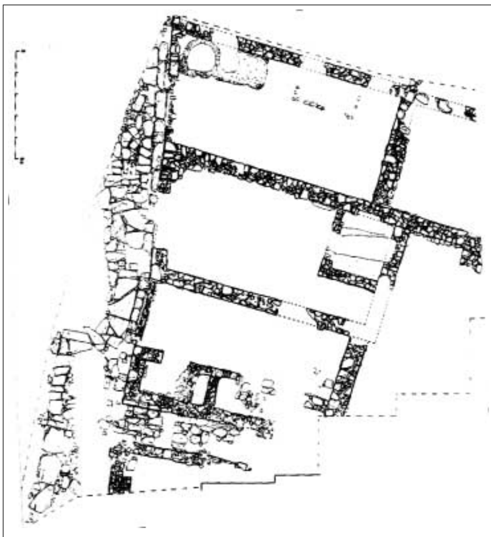
Plaza de la Iglesia de Monteagudo: planimetría general del conjunto excavado, con el cruce de calzadas y los tres recintos de planta rectangular

La cronología del contexto estratigráfico viene de la mano de fósiles directores, fundamentalmente terra sigillata y monedas; estos materiales sitúan el conjunto arquitectónico en época tardoaugustea o Julio-Claudia.