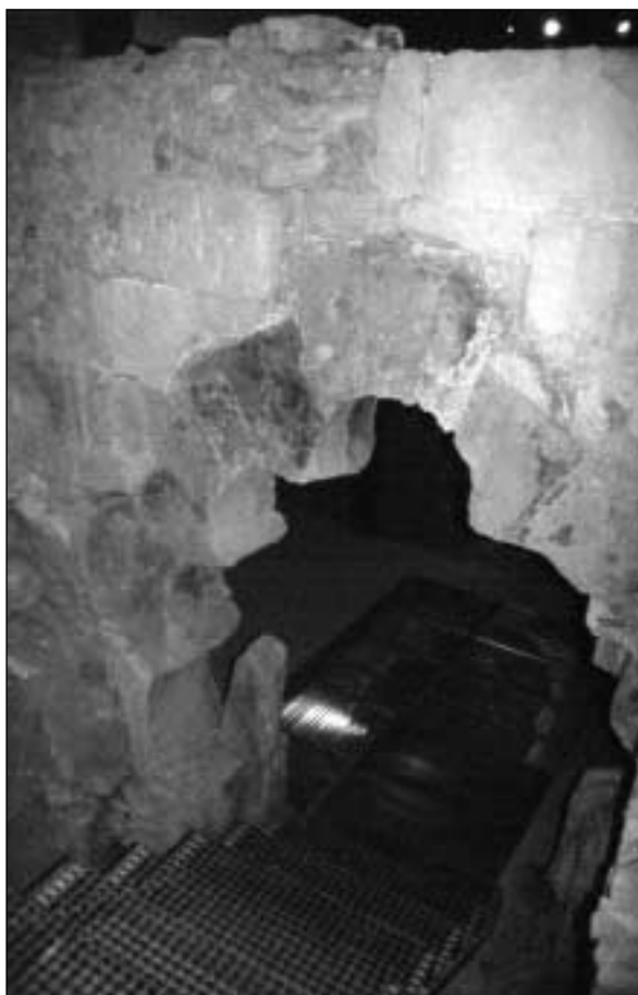
Ntra. Sra. la Real de Las Huertas: detalle del arco polilobulado localizado durante las obras de consolidación de la escalera de la Tota Pulchra

Bajo la capa superficial aparece un potente estrato de escombros que identificamos con la caída y destrucción de la torre de la iglesia del siglo xviii, que se ubicaba en las inmediaciones del lugar de la excavación. La torre se derrumbó en noviembre de 1901.