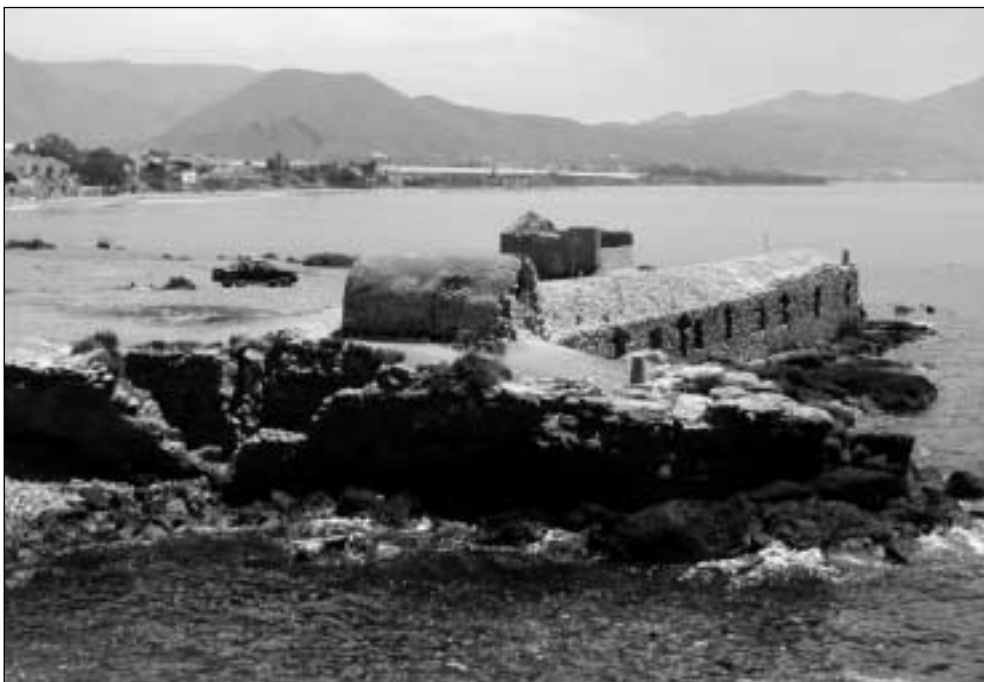
Vista general del edificio de los baños termales de Isla Plana

Las actuaciones de limpieza y documentación arqueológica efectuadas sólo constituyen una fase de los trabajos necesarios para poner en valor las edificaciones que contuvieron las instalaciones termales. El objeto principal de esta primera intervención fue analizar los espacios internos y su evolución.