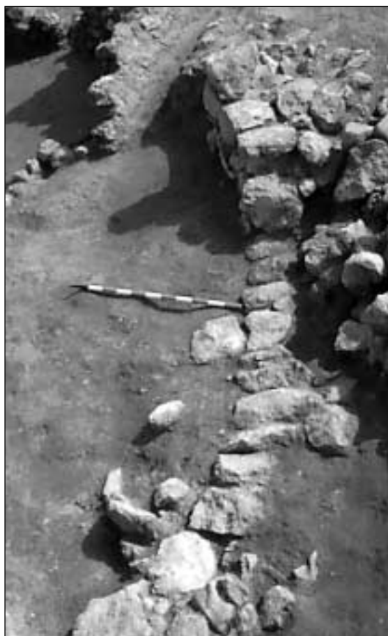
Punta de los Gavilanes: detalle de las estructuras documentadas en la campaña de 2001

Finalmente y en lo que a los niveles prehistóricos respecta, se han delimitado y dejado preparadas para acometer el estudio y posterior exhumación de sus niveles de ocupación interna y externa, al menos dos unidades domésticas de la Fase IV que, en la secuencia conocida del yacimiento identifica la ocupación del promontorio en época prehistórica reciente de la que hasta el momento sólo conocemos parte de otra unidad doméstica cuyo último período de ocupación se asocia culturalmente al final de la Edad del Bronce del sureste.