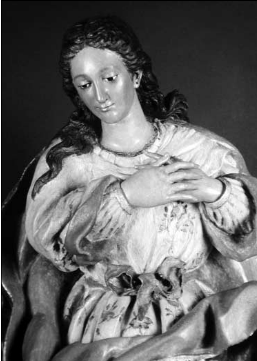
Virgen de Singla: estado actual tras la restauración