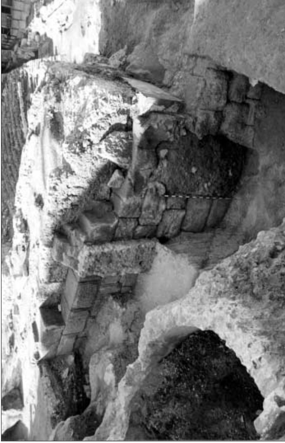
Teatro romano de Cartagena: detalle del sistema de accesos documentado en la campaña de 2001. En primer término, vomitorium de ingreso a la media cavea. Arriba a la izquierda, umbral de ingreso al porticus in summa gradatione y summa cavea