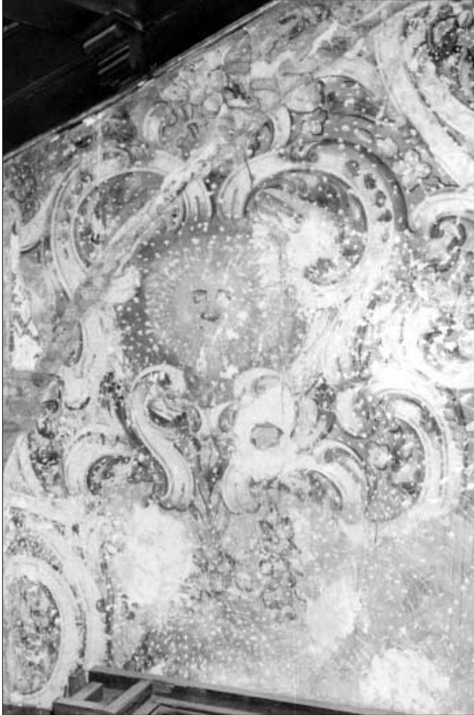
Pinturas murales de la iglesia de Ntra. Sra. de Loreto: anterior a su restauración