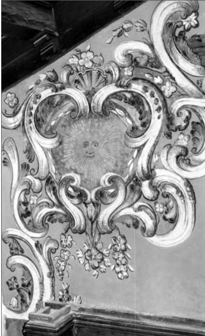
Pinturas murales de la iglesia de Ntra. Sra. de Loreto: estado actual tras la restauración