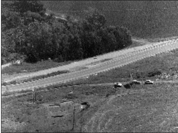
Foto 1. Vista general de la excavación.

bién resultaba estéril, decidimos profundizar con el fin de confirmar esa apreciación y descartar cualquier posibilidad de error en la interpretación.