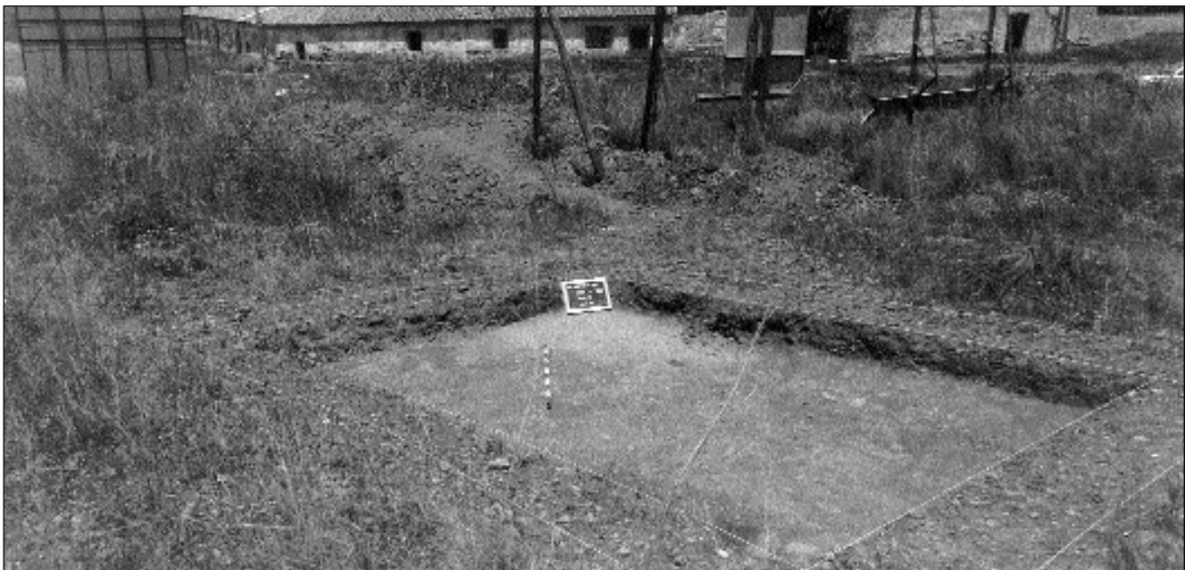
Foto 2. Detalle de una de las cuadrículas arqueológicas.

5. a ) El depósito que existe bajo la capa húmica superficial responde a las características de un depósito de pie de monte con materiales mal clasificados que ponen de manifiesto arroyadas y fenómenos de migración de carbonatos, ascensos por capilaridad y ligeros encostramientos que envuelven los clastos. Por la profundidad alcanzada es fácil descartar la existencia de materiales arqueológicos dentro o bajo este sedimento.