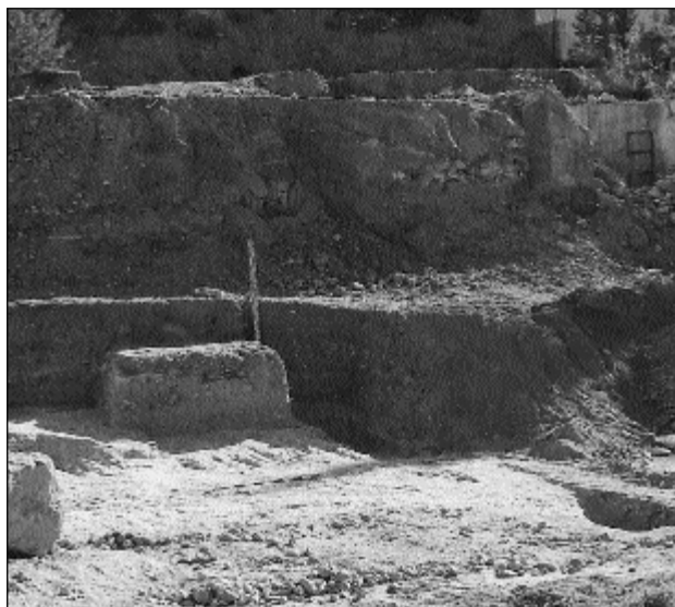
Vista general de las terrazas media e inferior y área de actuación arqueológica.

En principio se plantea un corte de 5 por 5 metros que afecta tanto a la parte alta como a la baja. Al limpiar el perfil que hay entre ambas se observa que la roca aparece a 0'40 m., por lo que se opta por rebajar sólo los extremos de