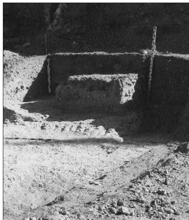
Detalle del área de actuación

V: Tierra marrón clara compacta, con abundancia de piedras de medio y pequeño tamaño y cerámica. Material ibérico.