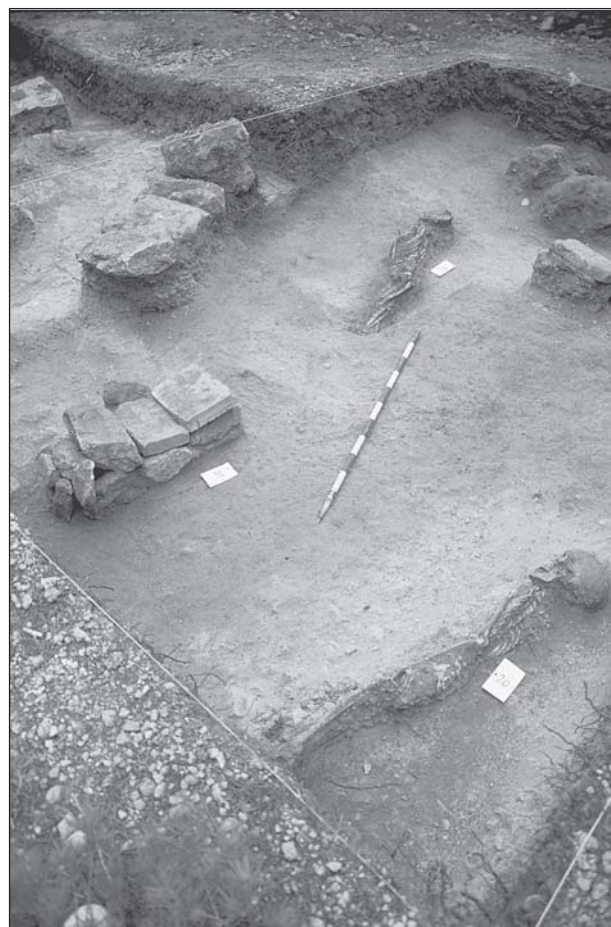
Figura 4. Maqbara islámica del Cerro del Castillo. Enterramientos.

Anverso: Busto coronado a izquierda con leyenda ARAGON.