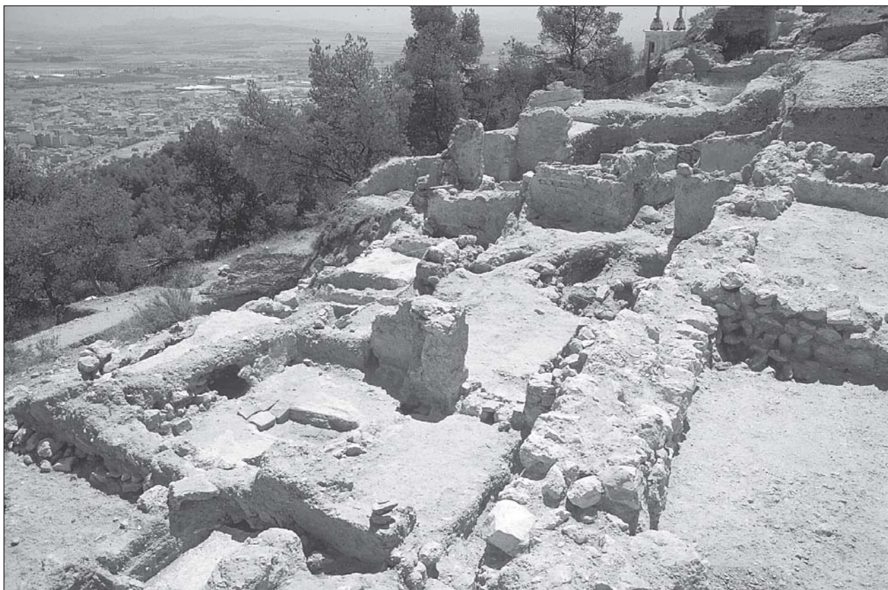
Figura 1: Castillo de Yecla. Reducto principal.

Ajuar Funerario: Fragmento de jarrita decorada con molduras verticales y un fragmento de moneda de plata, probablemente 1/2 quirate almorávide (ss. XI/XII).