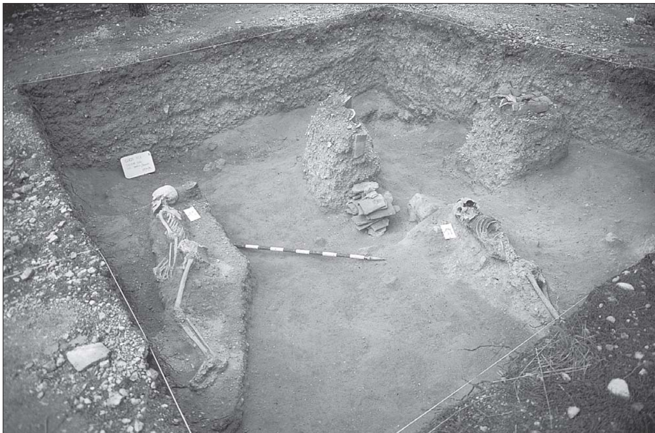
Figura 3. Maqbara islámica del Cerro del Castillo. Enterramientos.