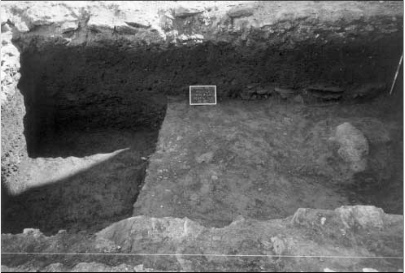
Figura 2.- C/ Marín Menú, 4. Vista general del Corte A.

persos que se documentan en un sondeo de 2 m. de anchura realizado en el sector Este del corte. Aparecen materiales de filiación romana similares a los del estrato IV. Tiene un espesor de 0,15 m. y se superpone a un potente nivel de limos estériles desde el punto de vista arqueológico.