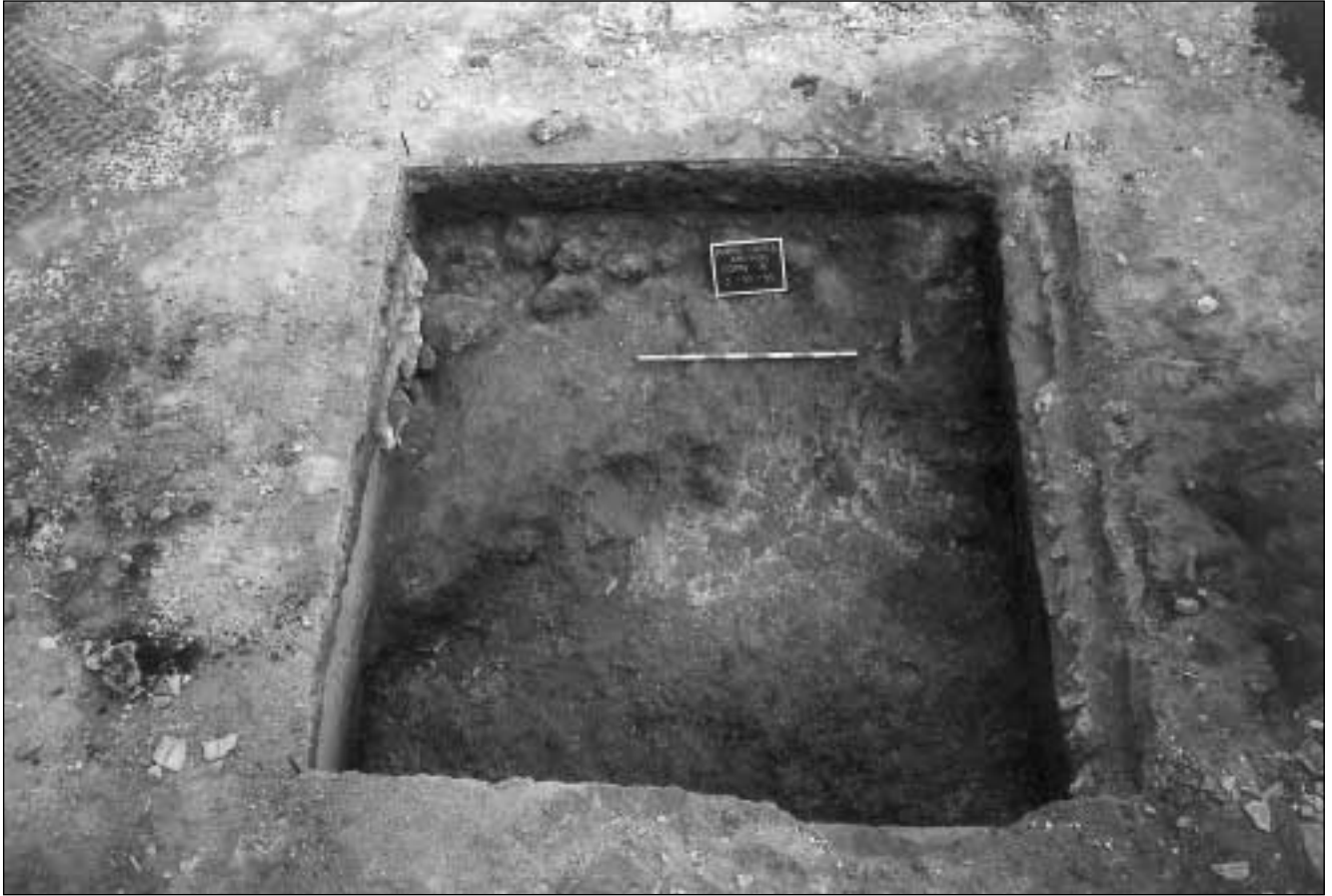
Figura 3.- Barrio Colón, 10. Vista cenital del Corte A.

mente por cerámicas campanienses, aunque en una zona cercana al hallazgo se encontró material arqueológico de cronología tardía. El yacimiento se incluyó en la Carta Arqueológica Hispanorromana (BELTRÁN, 1945).