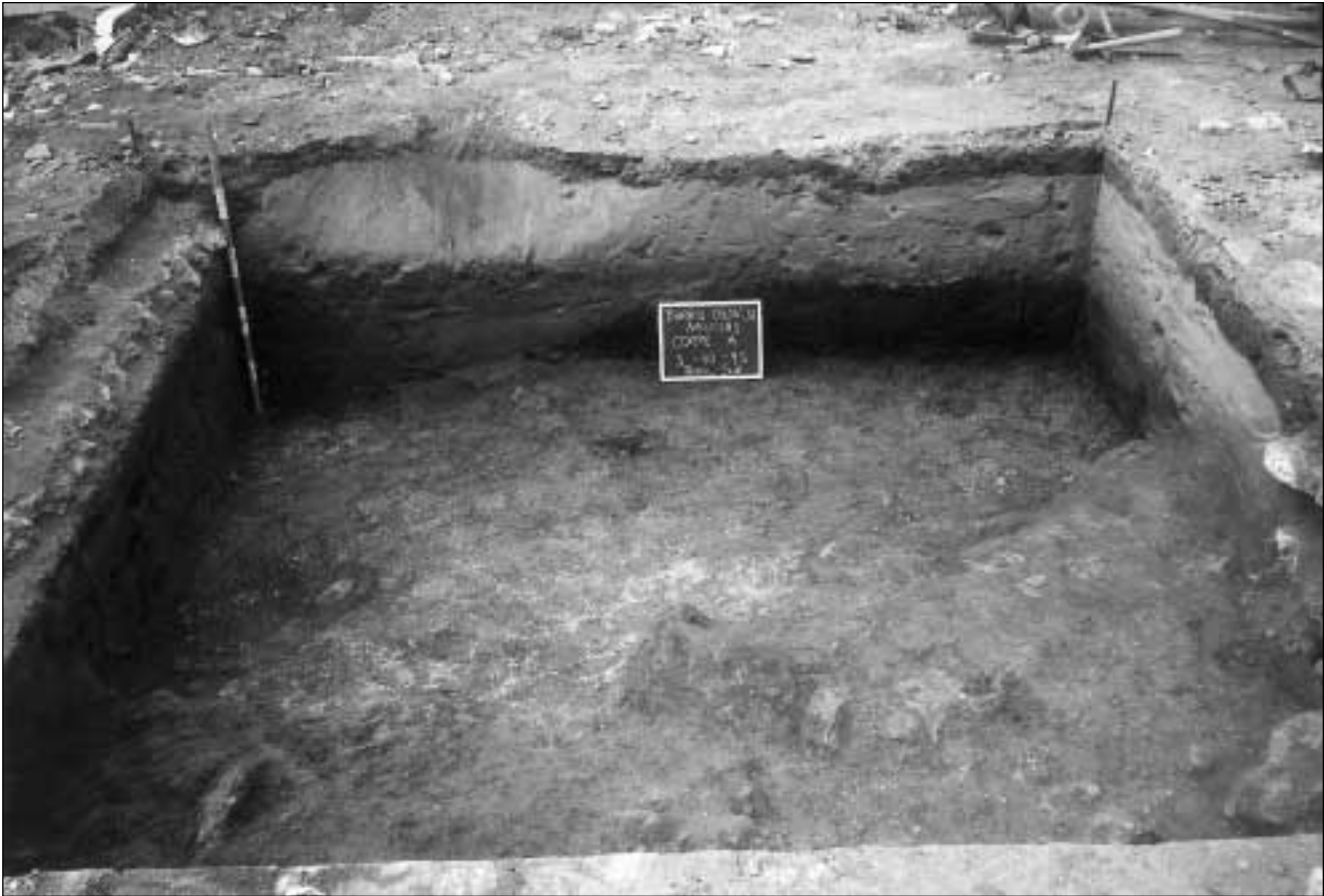
Figura 4.- Barrio Colón, 10. Corte A; Perfil Sur.

La parcela aquí objeto de estudio tiene planta rectangular, con 13 m. de lado mayor y 7,5 m. de profundidad que suponen 97,50 m 2 .