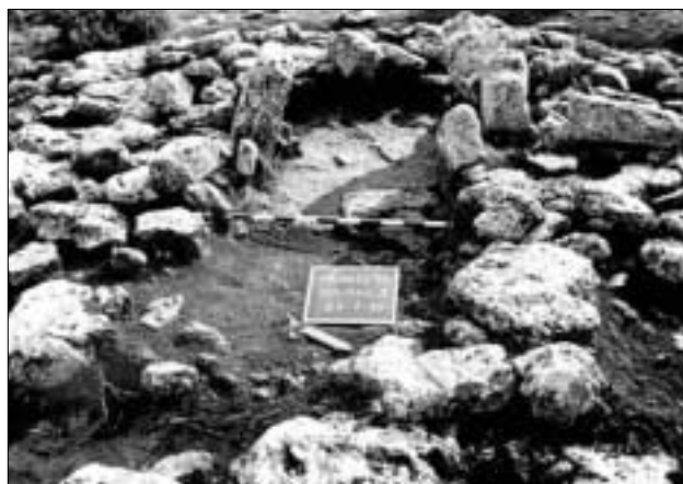
Lámina 2. Limpieza previa a la excavación del sepulcro megalítico Bajil 3.

primera serie de trabajos en campo, con el fin de redactar y publicar una primera memoria científica, una vez completados los informes parciales relativos a diversos materiales arqueológicos, de manera que podamos exponer las primeras conclusiones obtenidas, sin perjuicio de que la ulterior continuidad de los trabajos vayan matizando aspectos más concretos. De esta manera, el plan de trabajo de la campaña tenía como objetivos esenciales: completar la excavación en extensión de los niveles A1 y A2 en las zonas situadas al sur y oeste del Punto cero ( hasta completar todo el sector SW); excavar en profundidad (hasta completar el paquete de niveles B) en los cuadros 6 y 11; completar la excavación de los exteriores inmediatos al Edificio A, con el fin de registrar su relación con otros edificios contemporáneos; excavar el sepulcro megalítico Bajil 3, limpiar y dibujar la planta del sepulcro Bajil 6, y, por fin, consolidar y preservar las más significativas estructuras excavadas en todas las campañas.