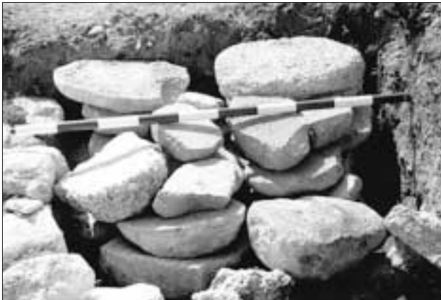
Lámina 3. Recuperación de molinos de mano durante la campaña.