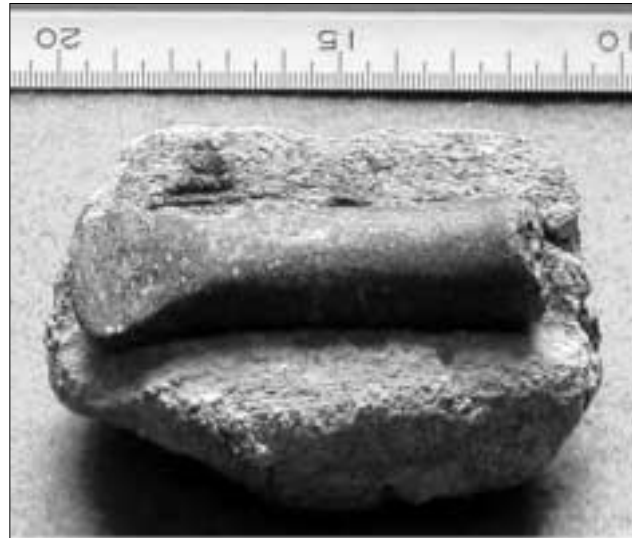
Lámina 4. Molde de fundición del cuadro 31-32, con el fragmento del escoplo que pudo originar.

recuperación de numerosos molinos de mano en el poblado, de los que hasta la fecha hay 57 ejemplares, depositados en un sector del yacimiento, protegidos por una capa de tierra. De ello se deriva la importancia de las tareas agrícolas, como principal fuente de abastecimiento alimentario para los habitantes de Bajil, durante la Edad del Bronce.