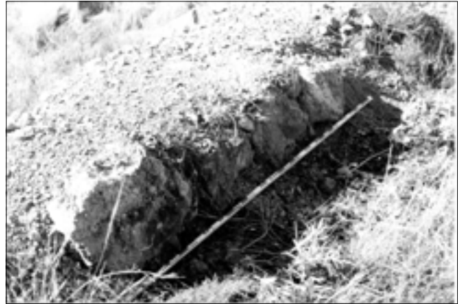
MURO 1. Exterior e Interior