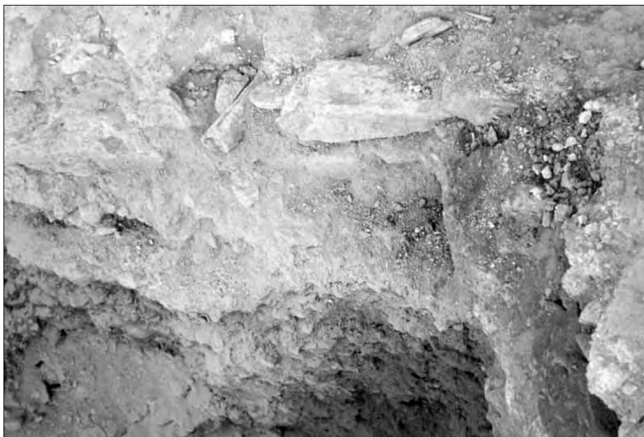
Lámina 4. Tubería de plomo de la pileta nº 1.

una distancia de 72 cm sobre el nivel infértil. La anchura media de este muro es de 60 cm y conserva una longitud de 2,23 m, aunque también éste continúa hacia el sur en el solar anexo. Este muro, que asienta directamente en el nivel II, se desmontó con el fin de poder documentar lo que se encontraba en niveles inferiores. Inmediatamente bajo el muro y todavía en el nivel II aparecieron materiales datables en los siglos I-III d.C., lo que ofrece una fecha posterior al siglo III d.C. para este muro. Por debajo de este nivel apareció un nivel de ceniza –nivel II D– ya documentado entre los muros 2 y 3 y sobre los restos de este último, aunque en esa zona no se había localizado material alguno; en la zona que nos ocupa bajo el muro 4, el nivel II D ofreció materiales de la segunda mitad del siglo I d.C. Bajo este nivel apareció nuevamente el II E de tierra arcillosa compacta, que tampoco ofreció material arqueológico. A continuación apareció el nivel III, ya descrito líneas arriba.