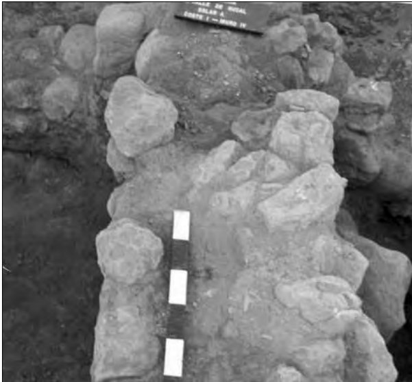
Lámina 1. Vista parcial del muro nº 4.

ras Ostia III, 332, Ostia I, 261 y Ostia I, 264, cazuelas Ostia III, 267 A y B y Lamboglia 10 A y platos Lamboglia 9 A. Las ánforas que se documentaron asociadas a este primer periodo son Mañá C 2 , Lamboglia 2, Beltrán II A, Dressel 1 A y Dressel 12.