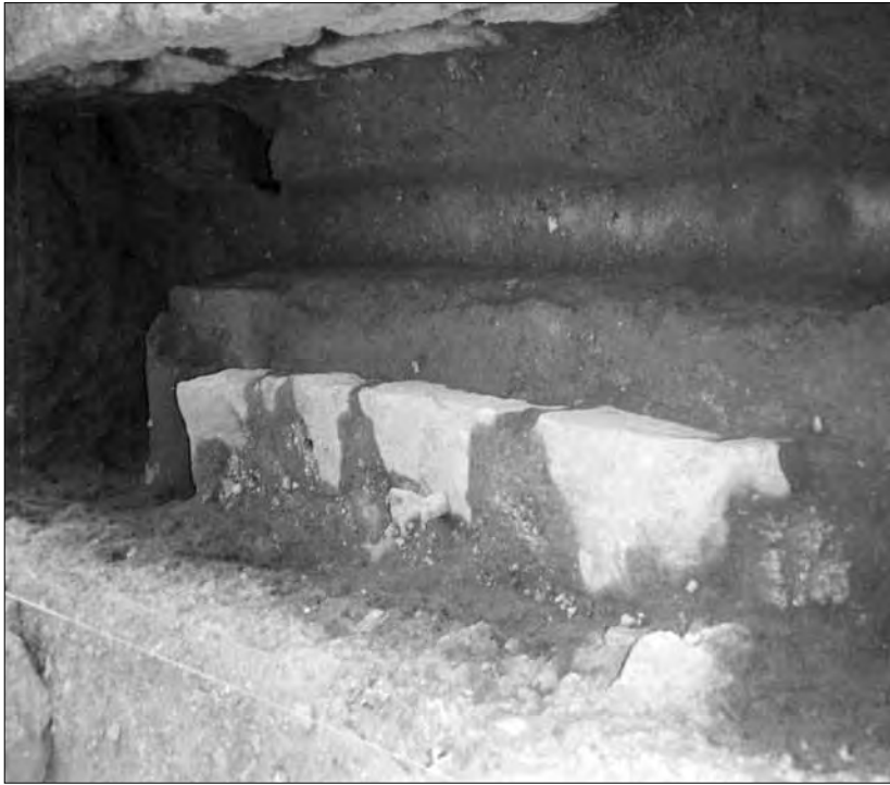
Lámina 5. Posible canal de desagüe de las piletas.

finas, datados entre la segunda mitad del siglo II a.C. hasta el I d.C., cronología similar a la que ofrece el material recuperado en la fosa de cimentación de este muro, del que podemos destacar un fragmento de fuente de T. S. Sudgálica Drag. 18 y el cuello de un ánfora Pascual 1.