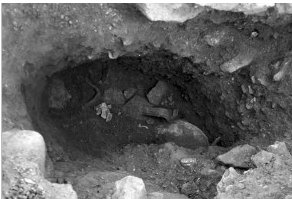
Lámina 2. Aspecto de la fosa localizada bajo el muro nº 4, en proceso de excavación.

En la cara oriental del muro hay, entre este nivel marrón claro y el estéril, una pequeña bolsada que alcanza hasta 13 cm de grosor, que se prolonga a lo largo de 84 cm; en ella se reconocieron tres niveles: un primer nivel gris, de 6 cm de espesor, con pequeñas piedras, donde aparecieron fragmentos informes de T. S. Clara A y C, junto a cazuelas de cerámica africana de cocina Ostia II, 310 y 312, lo que nos ofrece una datación entre fines del siglo I d.C. y mediados del siglo II para este estrato. El segundo nivel, de 4 cm de grosor, era arcilloso con piedras más grandes y en él se recuperaron un fragmento de paredes finas, que ofrece una amplia cronología (2ª mitad del siglo II a.C. hasta principios del siglo II d.C.) y otro de T. S. Sudgálica, que contribuye a ajustar la cronología en la 2ª mitad del siglo I d.C. El último nivel de la bolsada, separado del anterior por un fino estrato de cal de 1,5 cm, era de color verdoso con un espesor de 6 cm y en él se documentó un fragmento de T. S. Itálica Ettlínger 21 fechado entre los años 10 y 80 d.C. junto a material de cronología más amplia.