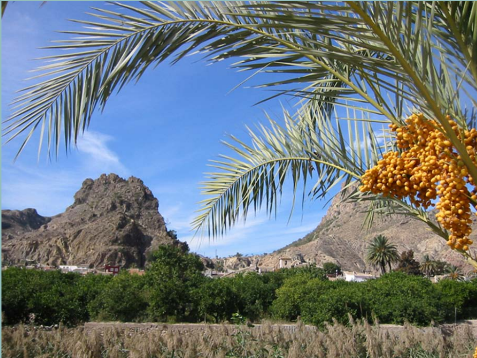
Valle de Ricote