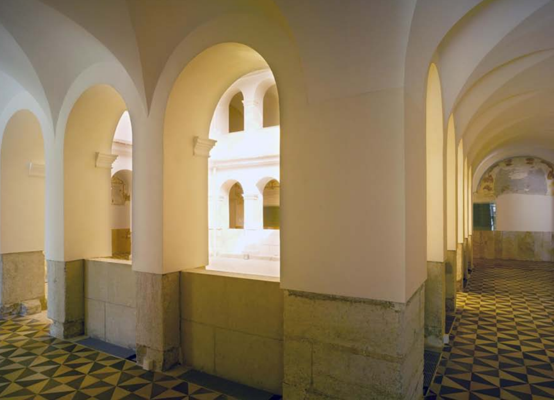
Convento de Franciscanos Descalzos de San Joaquín y San Pascual

FECHAS DE REALIZACIÓN: Martes 6, 13, 20 y 27 de octubre y 3 de noviembre de 2009.